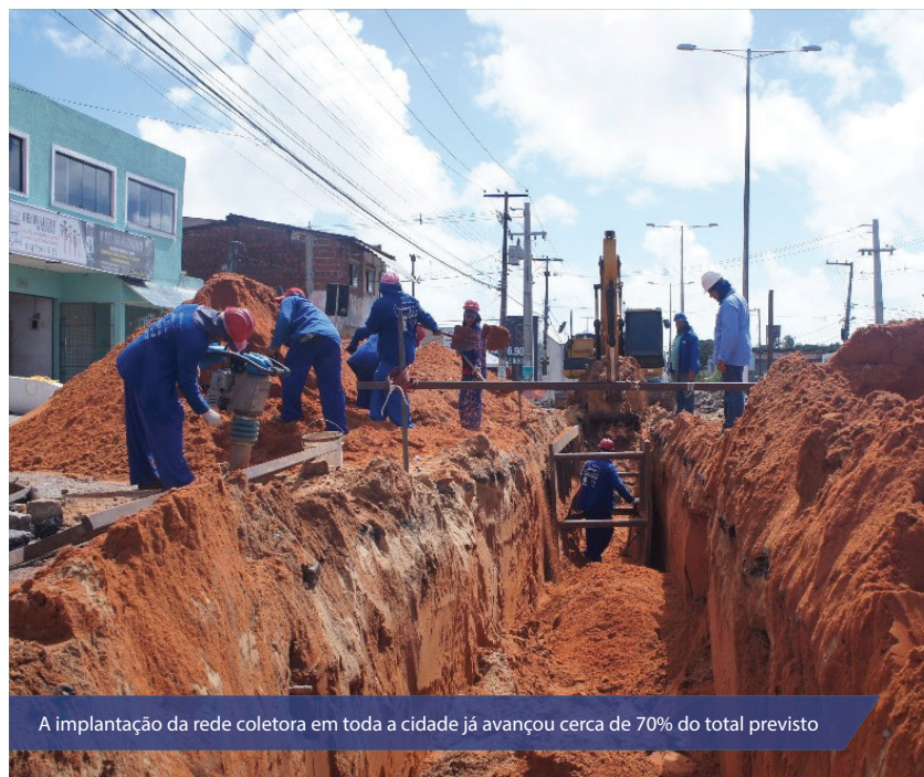
A implantação da rede coletora em toda a cidade já avançou cerca de 70% do total previsto

Os imóveis só podem ser interligados à rede quando são autorizados pela Caern, tendo em vista que o sistema não pode funcionar antes da conclusão das estações de tratamento de esgoto. As interligações já autorizadas são aquelas direcionadas para a Estação de Tratamento de Esgoto Dom Nivaldo Monte (ETE do Baldo), que está em funcionamento desde 2011. Na Zona Norte, por exemplo, as interligações serão liberadas quando do início do fun-