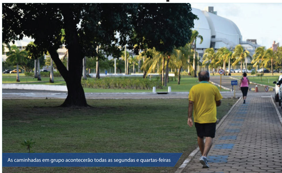
As caminhadas em grupo acontecerão todas as segundas e quartas-feiras

Ele também reforça a importância da alimentação pré-exercício físico, e orienta para o uso de roupas e calçados adequados durante a atividade, além, claro, de beber muita água.