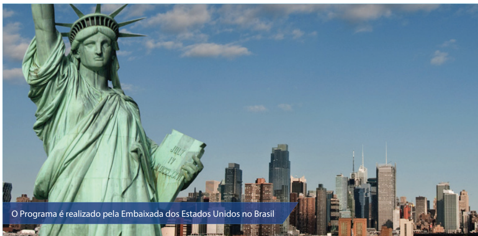
O Programa é realizado pela Embaixada dos Estados Unidos no Brasil

Estão abertas, até o dia 9 de agosto, as inscrições para o programa Jovens Embaixadores, realizado pela Embaixada dos Estados Unidos no Brasil, em parceria com as Secretarias Estaduais de Educação e uma rede de centros binacionais, além de empresas do setor privado que acreditam na juventude brasi-